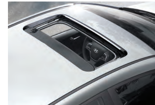
Cửa sổ trời điều khiển điện (Với phiên bản AT Đặc Biệt)