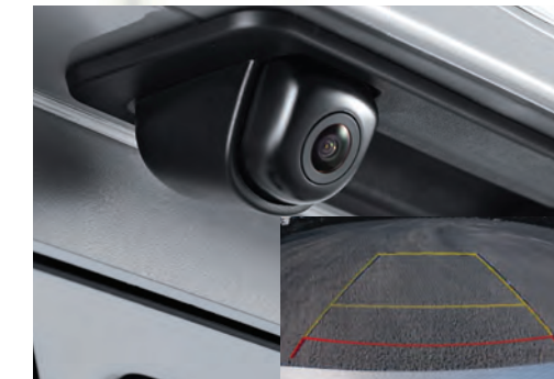
Camera lùi, kết hợp với cảm biến sau xe