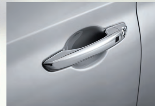
Tay nắm cửa mạ Crom