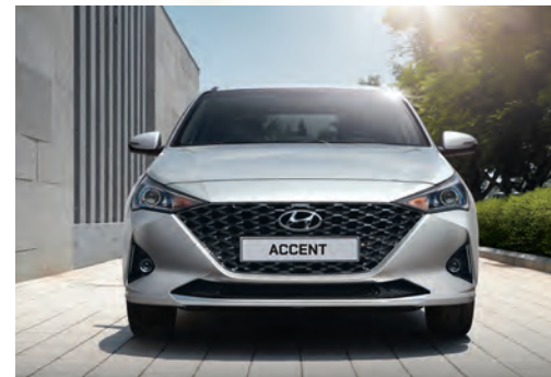
Thiết kế lưới tản nhiệt mạ crom đen kết hợp các khối hình đan xen nhau

Thiết kế mới của Hyundai Accent là một cuộc cách mạng, đem đến vẻ đẹp hấp dẫn của sự kết hợp giữa hiện tại và tương lai. Lưới tản nhiệt bắt mắt với các khối hình đan xen, táo bạo và lớp mạ crom tạo nên sự cao cấp. Đèn định vị LED với hệ thống chiếu sáng projector giúp bạn quan sát rõ hơn vào ban đêm đồng thời mang đến nét tinh tế công nghệ cao.