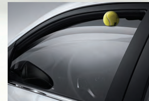
Cửa sổ chỉnh điện chống kẹt