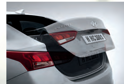
Cốp mở thông minh khi chìa khóa đến gần