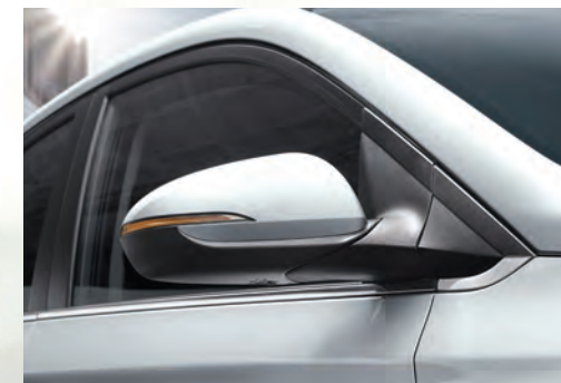
Đèn báo rẽ LED tích hợp trên gương