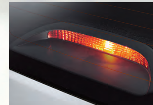
Đèn báo phanh trên cao