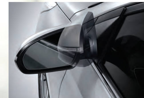
Gương chiếu hậu gập chỉnh điện