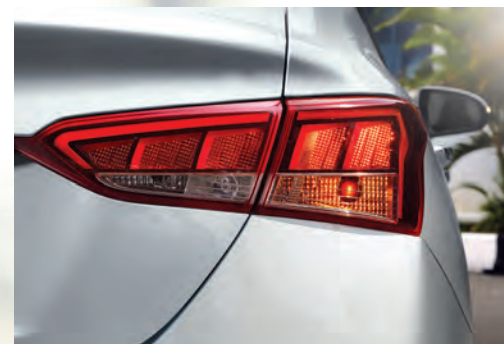
Đèn hậu công nghệ LED 3D