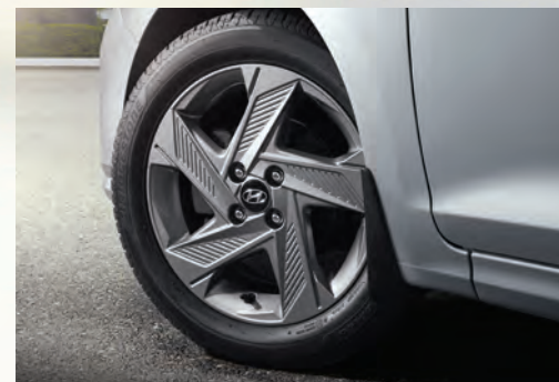
Lazang hợp kim 16 inch (Với phiên bản AT Đặc Biệt)