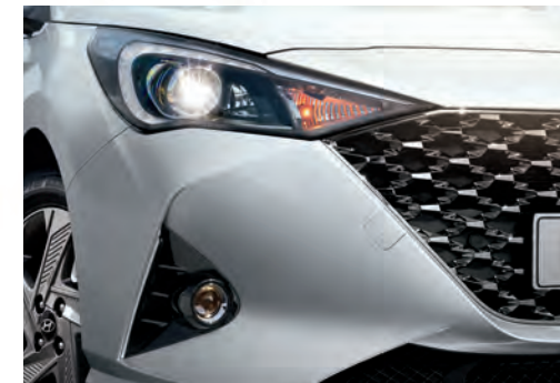
Dải đèn LED ban ngày DRL